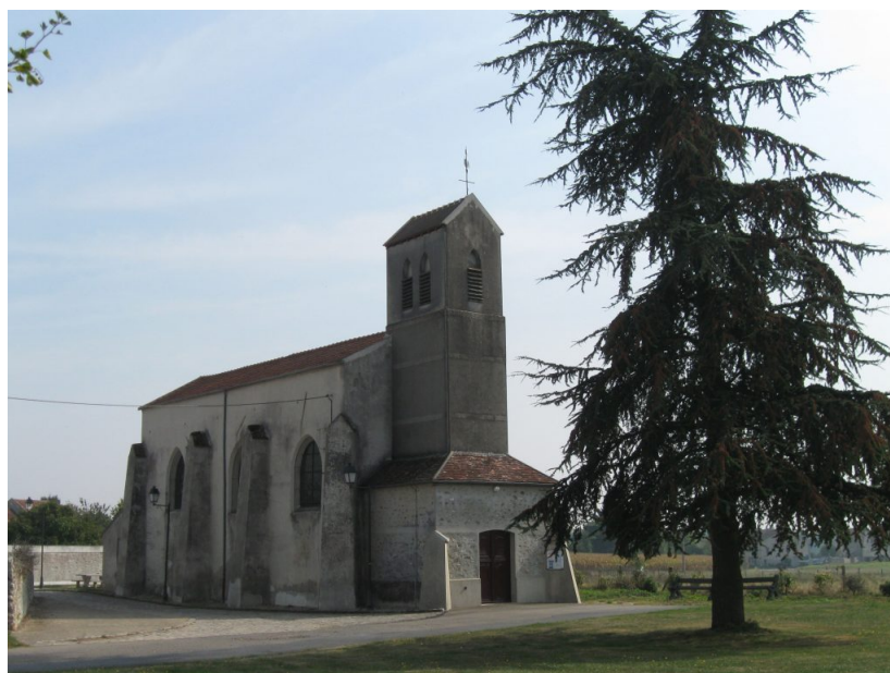
Eglise de Bussières